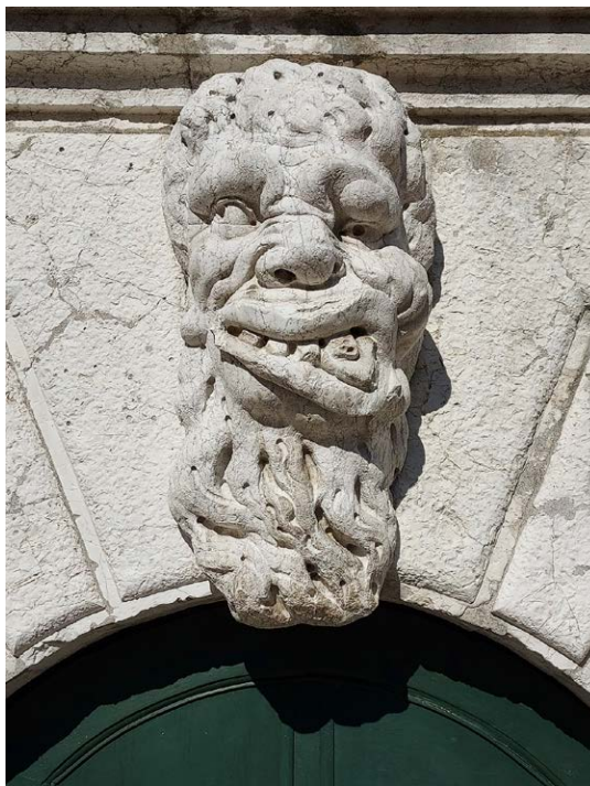
Velencei szörny (Santa Maria Formosa)

Van valami különös abban, hogy (többnyire) már nem látogatható kiállításokat járunk be újra, hiszen ami egykor beszámoló volt, most képzeletbeli útinaplóvá változik. Ám talán ez nem áll Velence lényegétől távol, amely – ahogy ezt Italo Calvino pontosan tudta – a leginkább képzeletbeli város. Még ha az időszaki tárlatok már el is tűntek, a bejárt útvonalak másokat is új sétákra ösztönözhetnek, új látnivalók felfedezésére, akár ezeken az utakon, akár ezektől távol, hiszen nincs csábítóbb kaland, mint eltévedni Velencében.