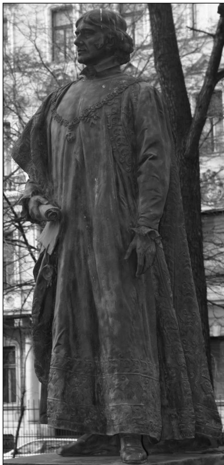
Istók János szobra a múzeumalapító Széchényi Ferencről a Magyar Nemzeti Múzeum kertjében

Fordulópontot jelentett a Magyar Nemzeti Múzeum megalapítása (1802), mivel ezzel létrejöttek az első tudományosan vizsgálható gyűjtemény keretei. 27 A Széchényi Ferenc által alapított intézmény a korabeli közép-európai kezde-