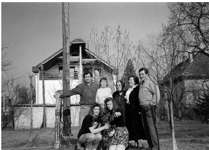
13. Család, 1992. „...Itt épül egyszer a házunk...”