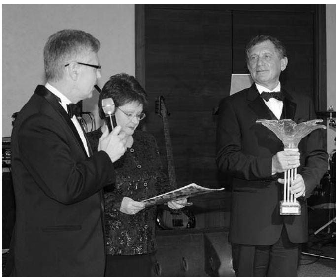
35. Az Év menedzsere díj átvétele, 2010