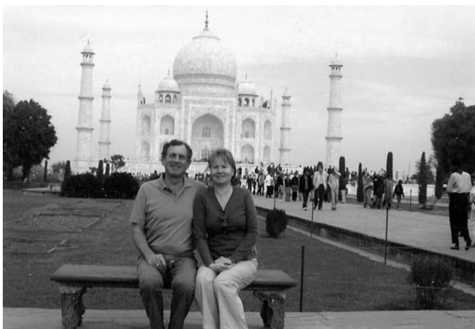
28. Taj Mahal, 2007