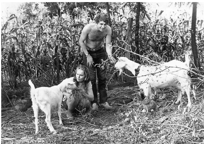
1. Fiatalkori kép, Sárszentmiklós, 1972. nyár