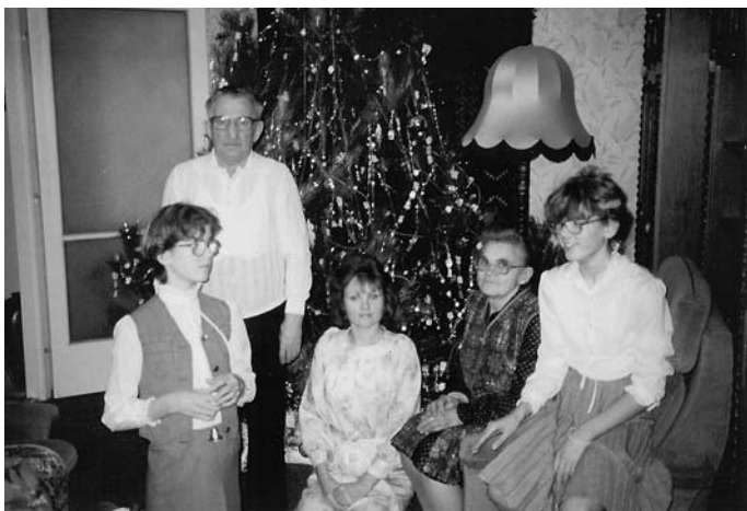
4. Család, 1981