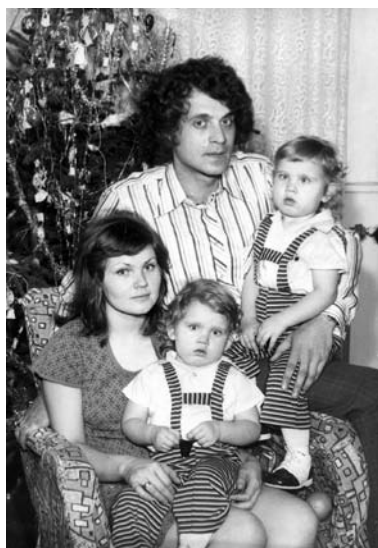
2. Karácsony a kicsikkel, 1975