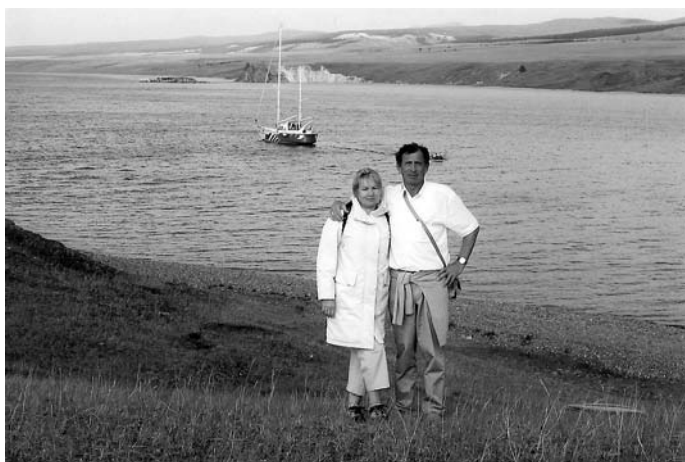
26. Nyaralás, Bajkál, 2005