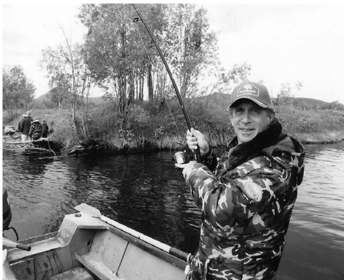
25. Kamcsatka, 2005