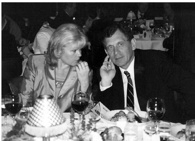
19. OICA-közgyűlés (Organisation Internationale des Constructeurs d'Automobiles), Budapest, 2002