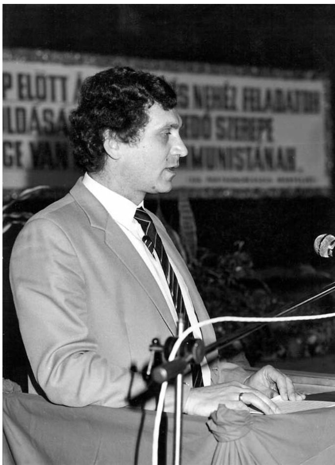
3. Beszéd az Ikarusban, 1981