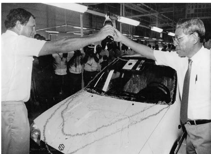
7. Az első magyar gyártmányú Suzuki Swift gépkocsi ünneplése Esztergomban Akira Shinoharával, 1991. augusztus