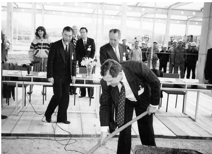
6. Suzuki gyár, alapkövetétel, 1990