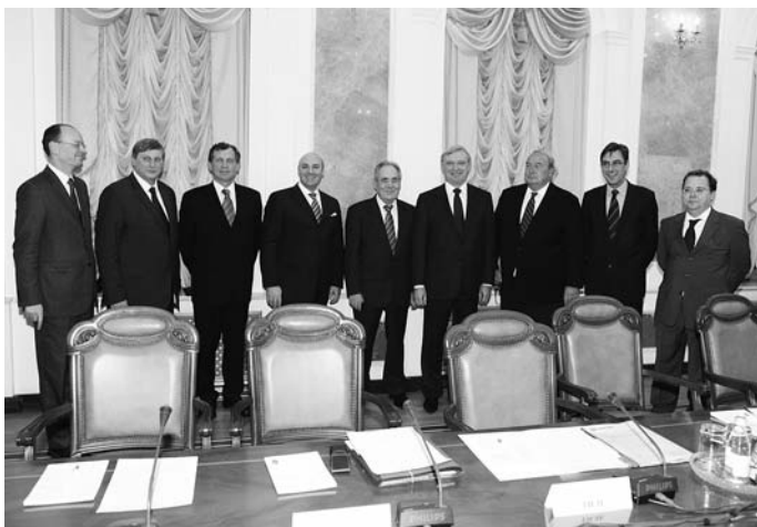
30. A Knorr-Bremse–KAMAZ Vegyesvállalat alapító szerződésének aláírása, 2007