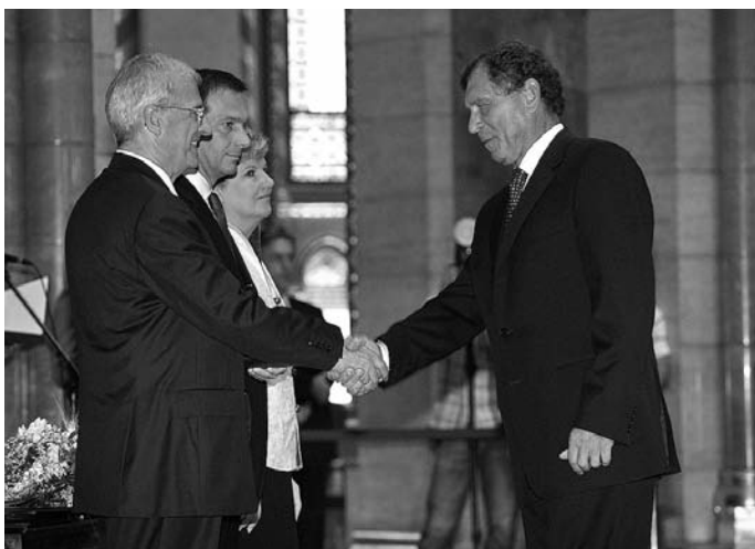
31. A Magyar Köztársaság Érdemrend középkeresztjének átvétele Sólyom László Köztársasági elnöktől, 2009