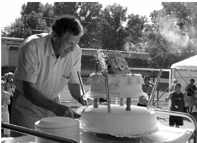
23. 100 éves a Knorr-Bremse, családi napi ünnepség, 2005