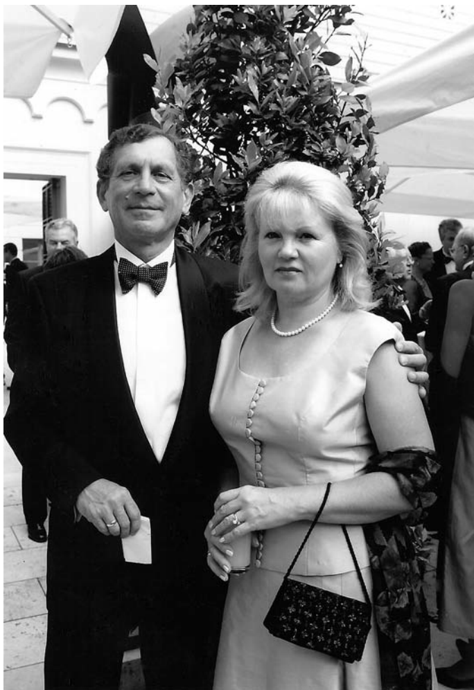
24. A Knorr 100. évfordulóján rendezett ünnepségen, feleségével, 2005