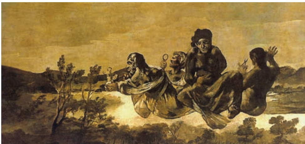
4. Francisco José de Goya: Atroposz vagy a Párkák (El destino) , 1821–1823, olaj, kasírozott vászon, 123 x 266 cm, Museo del Prado, Madrid