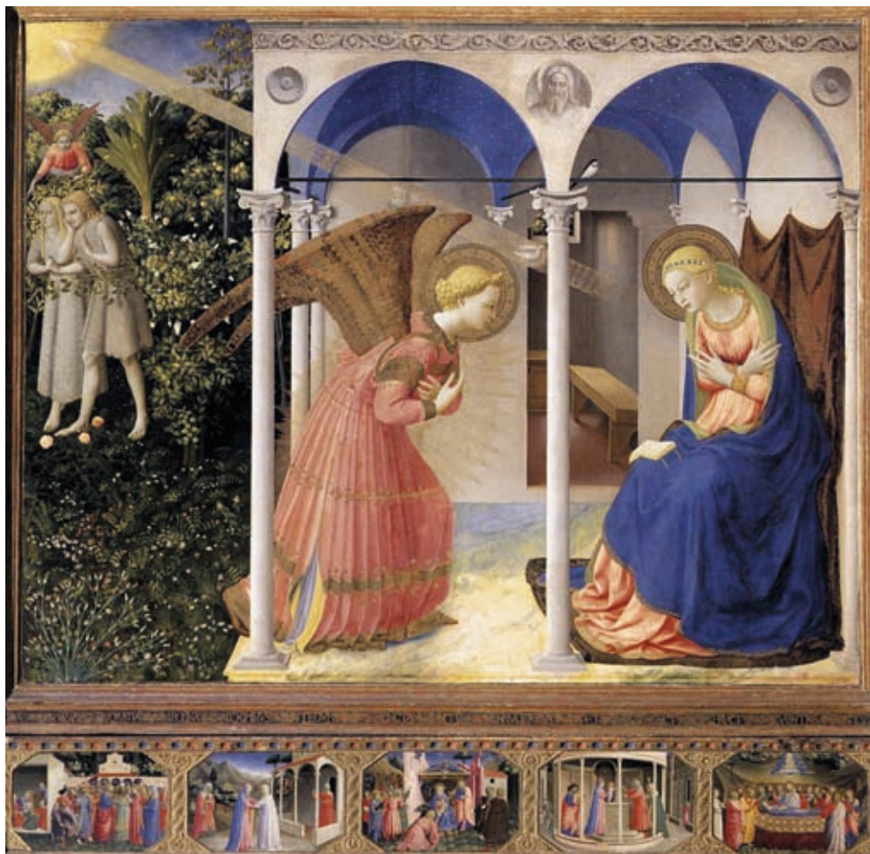
2. Fra Angelico: Angyali üdvözlét , tempera, fa, 194 x 194 cm, Museo del Prado, Madrid