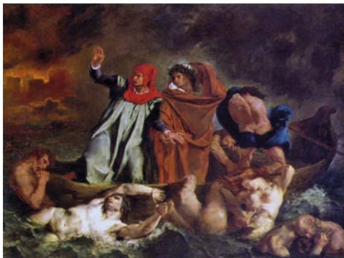
16. Eugène Delacroix: Dante bárkája , 1822, olaj, vászon, 189 x 246 cm, Musée du Louvre, Párizs