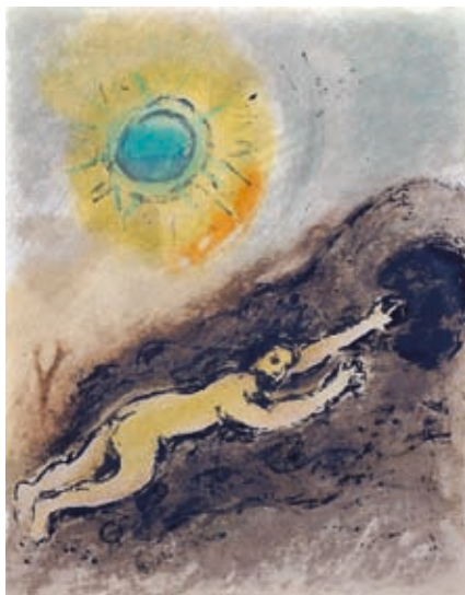
49. Marc Chagall: Sziszüphosz, 1975, litográfia