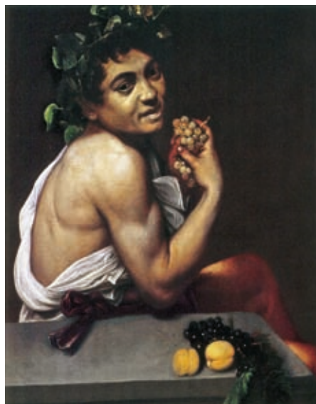
60. Caravaggio: A beteg Bakkhosz-gyermek, 1593 k., olaj, vászon, 67 x 53 cm, Galleria Borghese, Róma