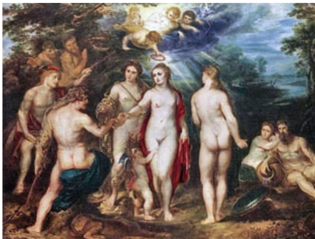
13. Peter Paul Rubens: Párizs ítélete, 1625, olaj, vászon, 139 x 174 cm, National Gallery, London