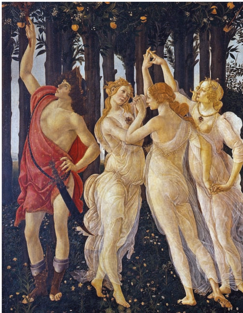
21. Sandro Botticelli: Tavaszi , 1482 k., tempera, fatábla, 203 x 314 cm, Galleria degli Uffizi, Firenze