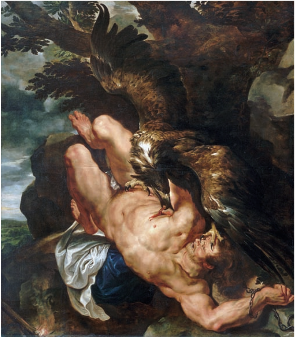
36. Peter Paul Rubens: Leláncolt Prométheusz , 1610–1611, olaj, vászon, 243 x 210 cm, Museum of Art, Philadelphia