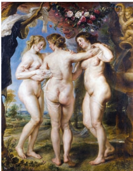
15. Peter Paul Rubens: A három Grácia , 1639, olaj, fa, 221 x 181 cm, Museo del Prado, Madrid