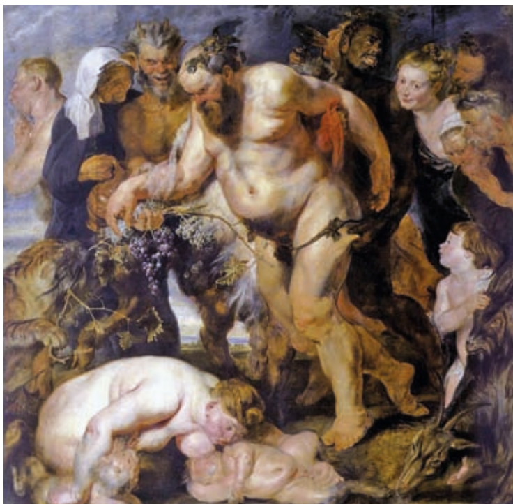
58. Peter Paul Rubens: A részeg Szilénosz, 1616–1617, olaj, fa, 212 x 214,5 cm, Alte Pinakothek, München