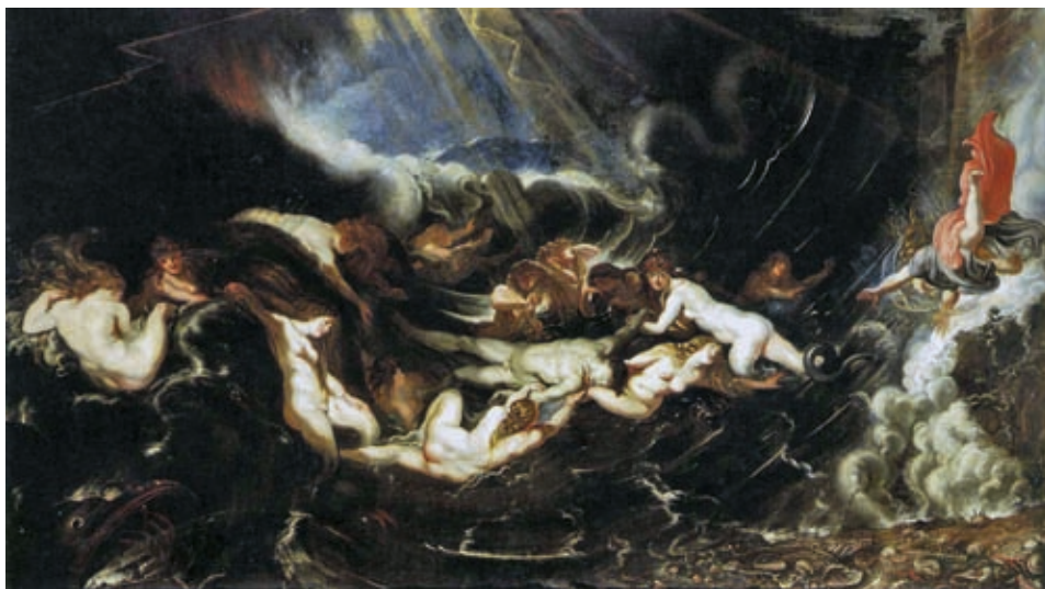
51. Peter Paul Rubens: Héro és Leander , 1605 k., olaj, vászon, 128 x 217 cm, Gemäldegalerie, Drezda