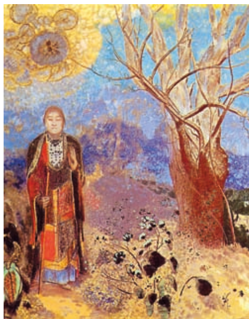
18. Odilon Redon: Buddha , 1905 k., pasztell, 90 x 73 cm, Musée d'Orsay, Párizs