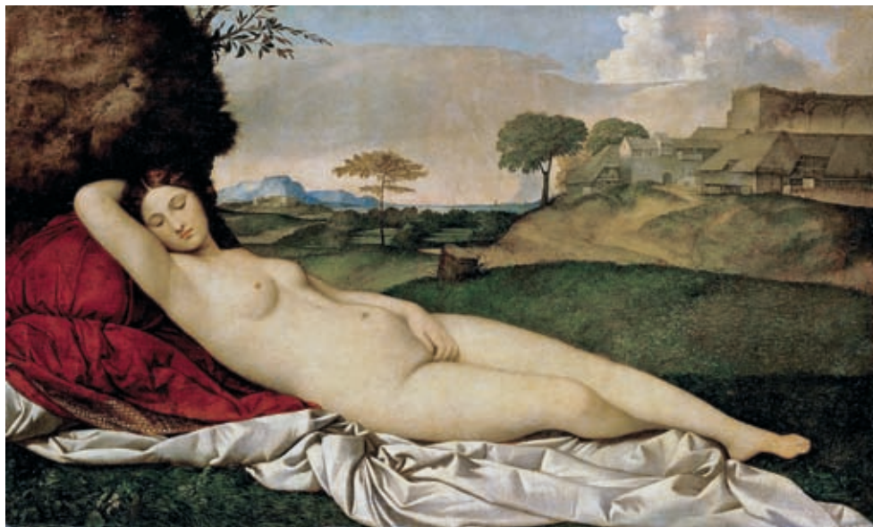
33. Giorgione: Alvó Venus, 1510 k., olaj, vászon, 108 x 175 cm, Gemäldegalerie, Drezda