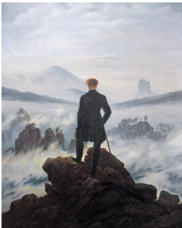
10. Caspar David Friedrich: Vándor a ködtenger felett, 1817–1818, olaj, vászon, 95 x 75 cm, Kunsthalle, Hamburg