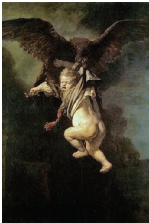
43. Rembrandt Harmenszoon van Rijn: Ganümedész elrablása , 1635, olaj, vászon, 171 x 130 cm, Gemäldegalerie, Drezda