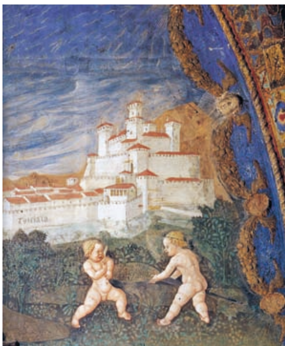
25. Bembo Benedetto: Pier Mariát és Biancát eltalálják Ámor nyilai, 1460 k., Golden Room, Castello di Torrechiara, Torrechiara