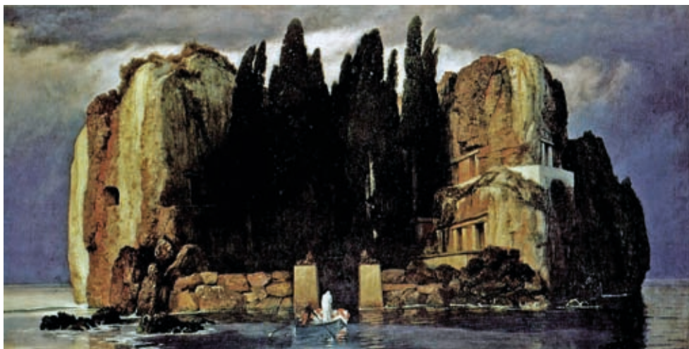
9. Arnold Böcklin: A holtak szigete, 1880, olaj, vászon, 111 x 155 cm, Öffentliche Kunstsammlung, Bázel