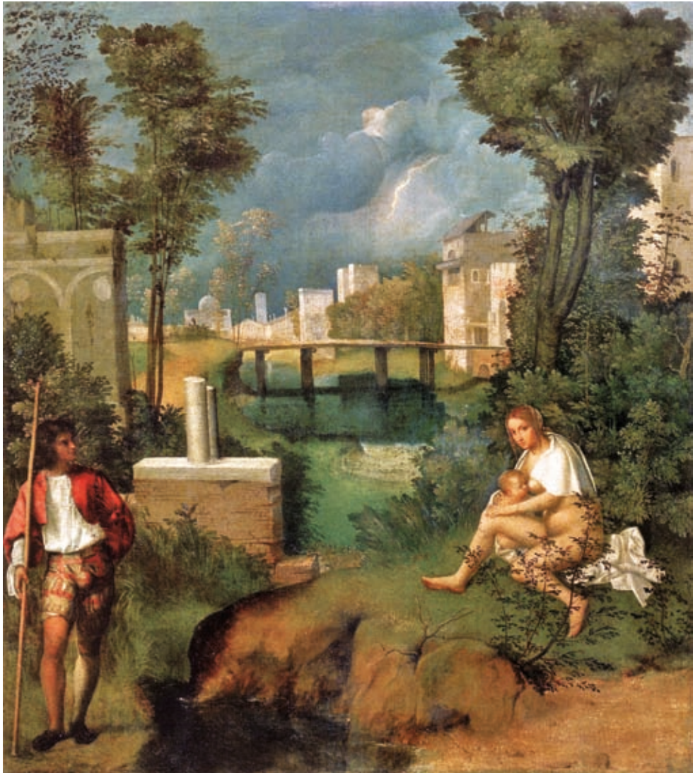
6. Giorgione: A vihar , 1505 k., olaj, vászon, 82 x 73 cm, Gallerie dell'Accademia, Velence