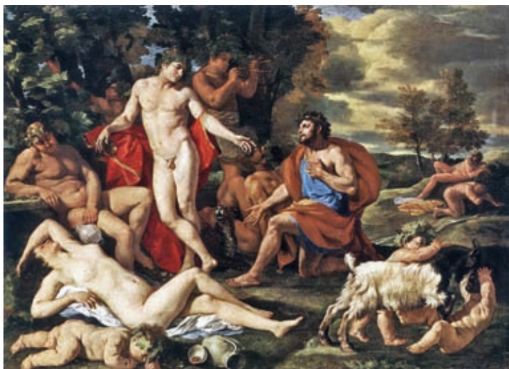
59. Nicolas Poussin: Midasz és Bakkhosz, 1629–1630, olaj, vászon, 98 x 130 cm, Alte Pinakothek, München