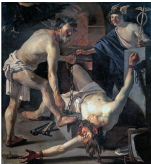
38. Dirck van Baburen: Vulcanus leláncolja Prométheuszt, 1623, olaj, vászon, 202 x 184 cm, Rijksmuseum, Amszterdam