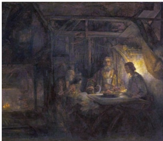
54. Rembrandt Harmenszoon van Rijn: Philémón és Baukisz , 1658, olaj, fatábla, 55 x 69 cm, National Gallery of Art, Washington