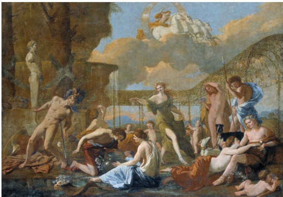
50. Nicolas Poussin: Flóra birodalma , 1631, olaj, vászon, 131 x 182 cm, Gemäldegalerie, Drezda