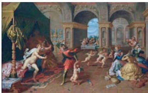
26. Simon de Vos: Ámor megfenyítése, Nationalgalerie, Berlin