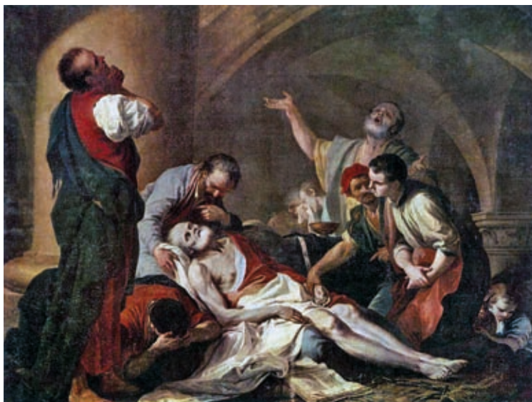
24. Giambettino Cignaroli: Szókratész halála, olaj, vászon, 202 x 271 cm, Szépművészeti Múzeum, Budapest