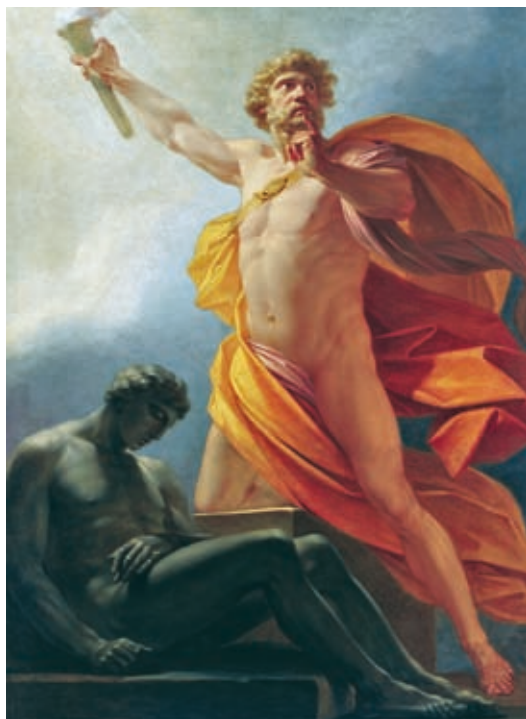
39. Heinrich von Füger: Prométheusz elhozza a tüzet az emberiségnek , 1817 k., Liechtenstein Museum, Liechtenstein