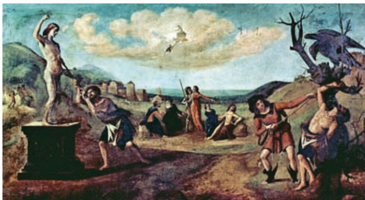
42. Piero di Cosimo: Prométheusz mítosza , 1515, olaj, fatábla, Musée des Beaux-Arts, Strasbourg