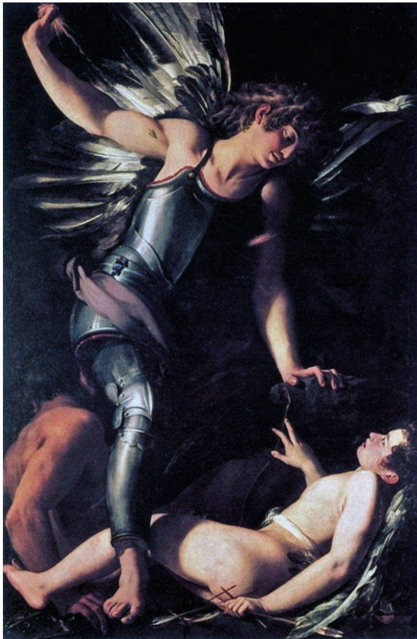
35. Giovanni Baglione: Az égi Ámor legyőzi a földi Ámort , 1602–1603, olaj, vászon, 179 x 118 cm, Staatliche Museen, Berlin