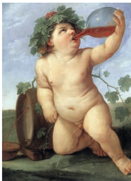
62. Guido Reni: Részeg Bakkhosz, 1623 k., olaj, vászon, 72 x 56 cm, Gemäldegalerie, Drezda