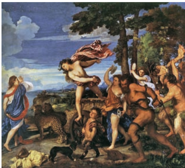
20. Tiziano Vecellio: Bakkhosz és Ariadné, 1520–1522, olaj, vászon, 175 x 190 cm, National Gallery, London