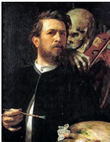
53. Arnold Böcklin: Önarckép a hegedűs halállal , 1871–1874, olaj, vászon, 75 x 61 cm, Nationalgalerie, Berlin