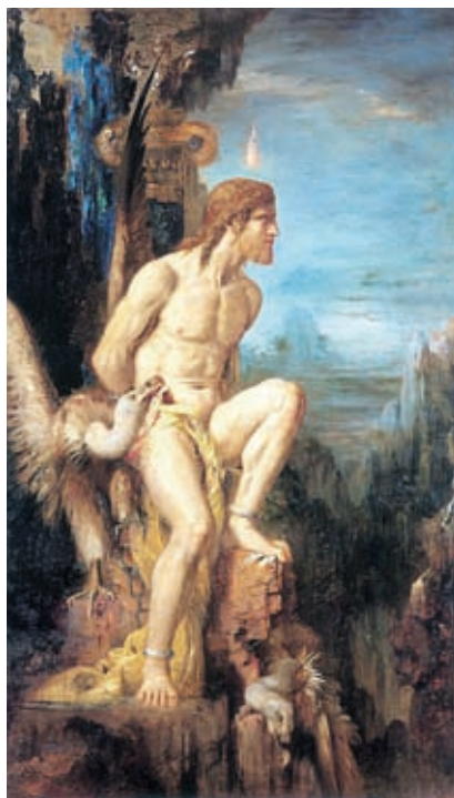
40. Gustave Moreau: Prométheusz , 1868, olaj, vászon, Musée Gustave Moreau, Párizs