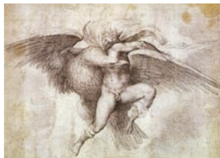
44. Michelangelo: Ganümedész elrablása , 1550-es évek, fekete kréta barnás papíron, 361 x 275 mm, Fogg Art Museum, Cambridge