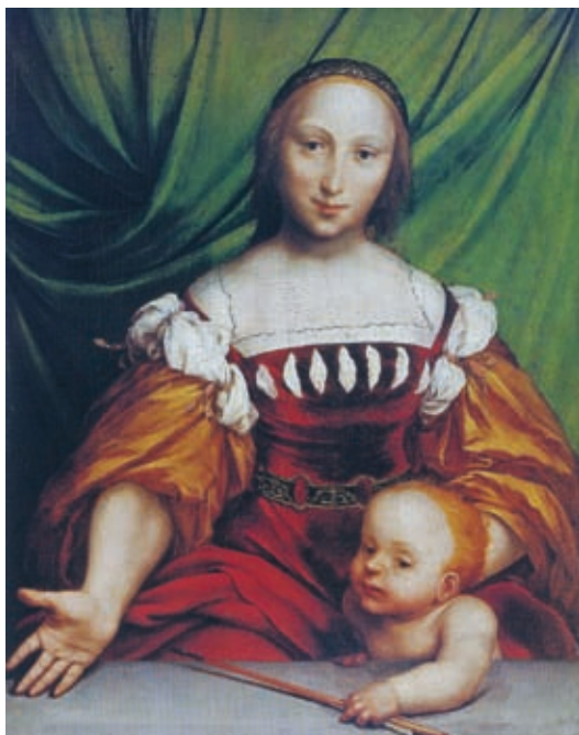
32. Hans Holbein (ifjabb): Venus és Ámor, 1524–1525, hársfa, 34,6 x 26,2 cm, Kunstmuseum, Öffentliche Kunstsammlung, Bázél