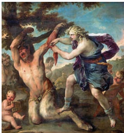
11. Luca Giordano: Apollón megnyúzza Marszüaszt, 1695 k., Reggia di Caserta