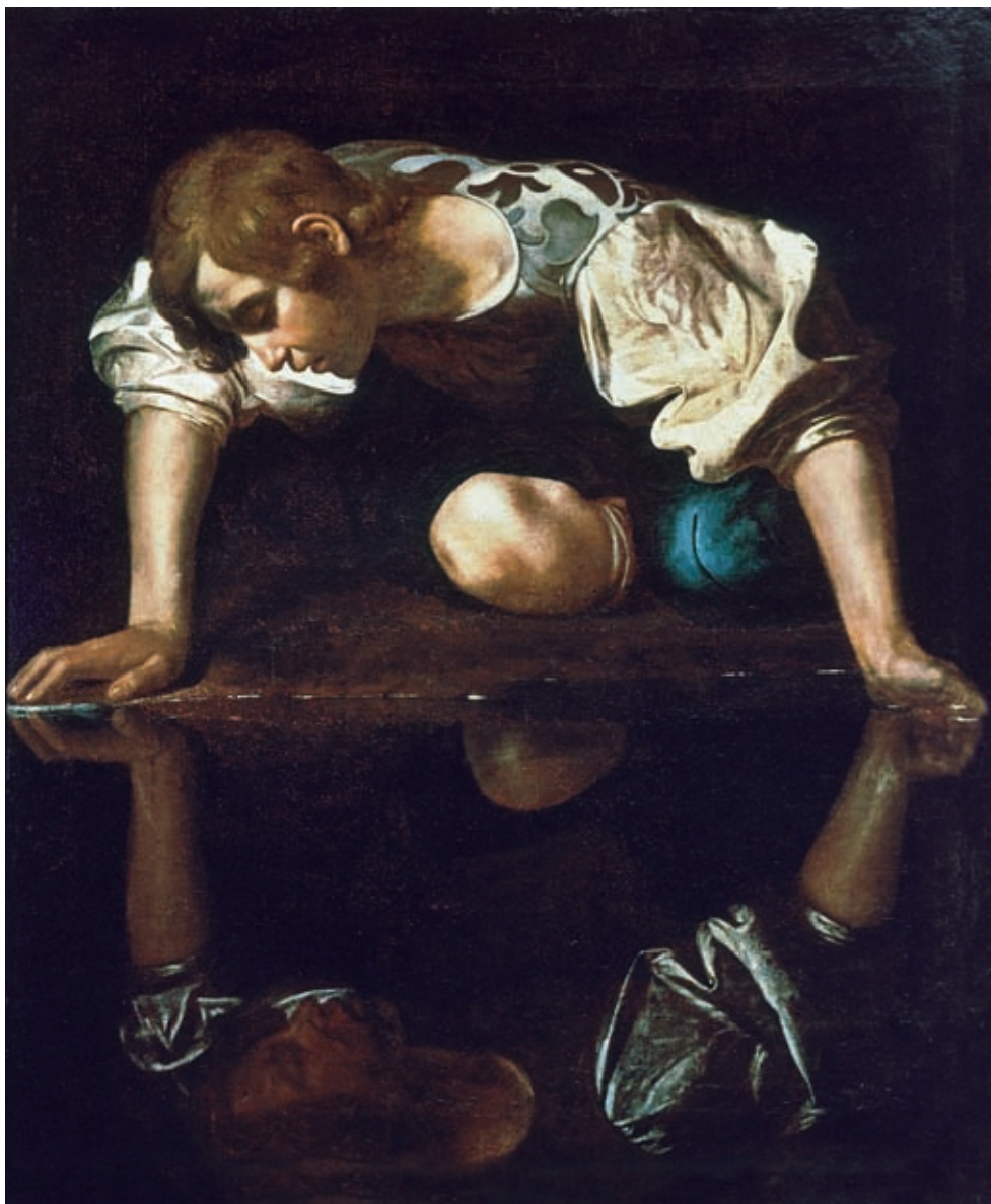
1. Caravaggio: Nárcisz , 1598–1599, olaj, vászon, 110 x 92 cm, Galleria Nazionale d'Arte Antica, Róma