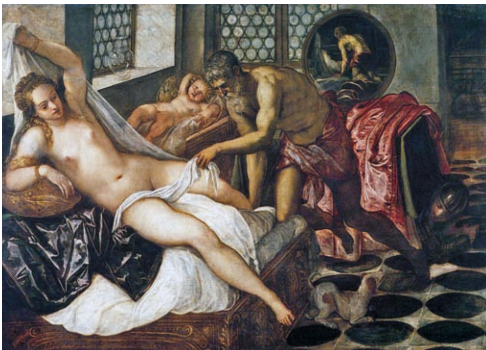
27. Jacopo Tintoretto: Venus, Mars és Vulcanus, 1551 k., olaj, vászon, 135 x 198 cm, Alte Pinakothek, München