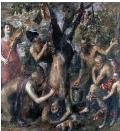
12. Tiziano Vecellio: Marszüasz megnyúzása, 1576, olaj, vászon, 212 x 207 cm, State Museum, Kromeriz