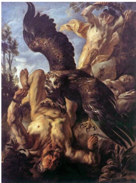
37. Jacob Jordaens: Leláncolt Prométheusz, 1640 k., olaj, vászon, 245 x 178 cm, Wallraf-Richartz-Museum, Köln