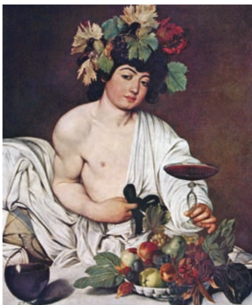
61. Caravaggio: Bakkhosz, 1596 k., olaj, vászon, 95 x 85 cm, Galleria degli Uffizi, Firenze