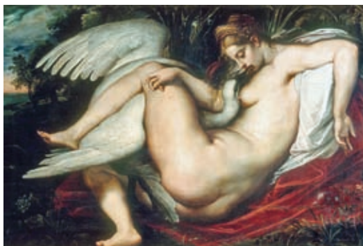
56. Peter Paul Rubens: Léda és a hattyú, 1598–1602, olaj, fa, 65 x 81 cm, Fogg Art Museum, Cambridge