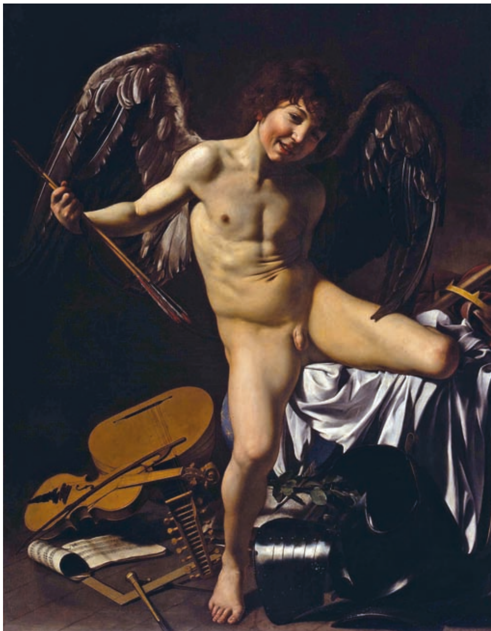
29. Caravaggio: Győzedelmes Ámor , 1602–1603, olaj, vászon, 156 x 113 cm, Staatliche Museen, Berlin