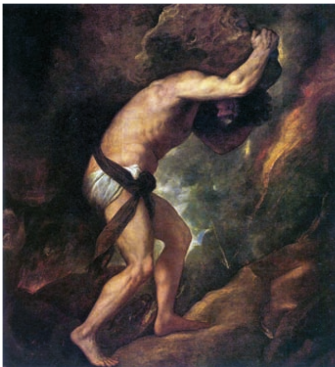
47. Tiziano Vecellio: Sziszüphosz, 1548–1549, olaj, vászon, 237 x 216 cm, Museo del Prado, Madrid