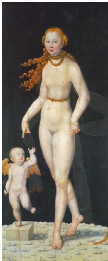
31. Lucas Cranach (ifjabb): Venus és Ámor , fa, 196 x 89 cm, Alte Pinakothek, München