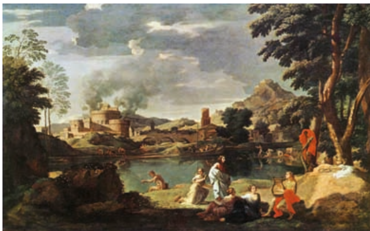
5. Nicolas Poussin: Orpheusz és Eurüdiké , 1648, olaj, vászon, 124 x 200 cm, Musée du Louvre, Párizs