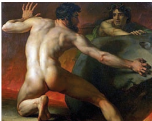
48. Alexandre Denis Abel de Pujol: Sziszüphosz