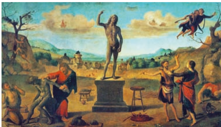
41. Piero di Cosimo: Prométheusz mítosza , 1515, olaj, fatábla, Alte Pinakothek, München