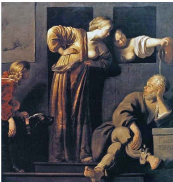
22. Reyer van Blommendael: Xantippé leönti Szókratészt, 1655 k., Musée des Beaux-Arts de Strasbourg, Strasbourg