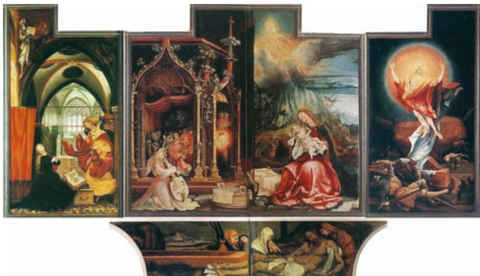
3. Mathias Grünewald: Isenheimi szárnyas oltár , 1512–1516, olaj, fa, Musée d'Unterlinden, Colmar