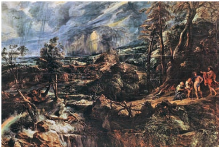
55. Peter Paul Rubens: Rubens: Viharos táj, 1625 k., olaj, fa, 147 x 209 cm, Kunsthistorisches Museum, Bécs