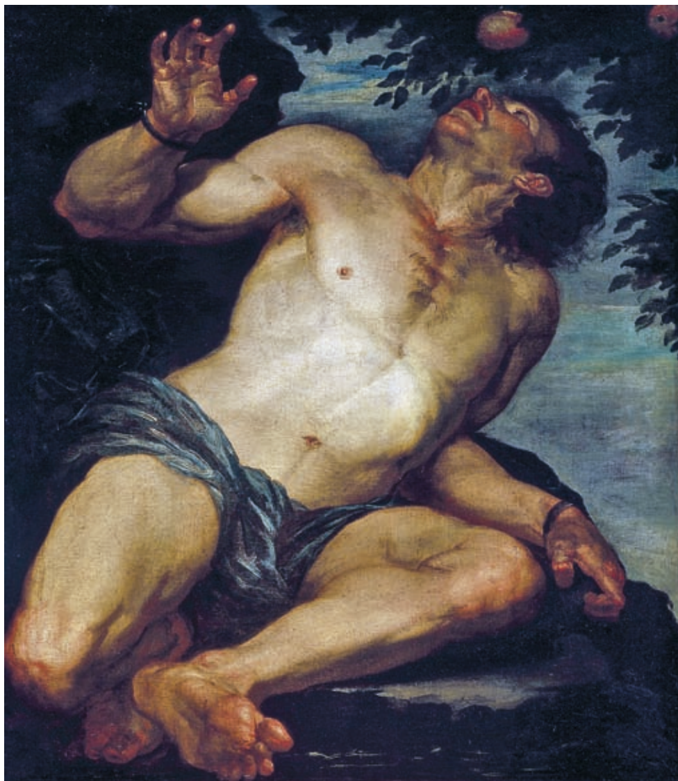
28. Gioacchino Assereto: Tantalosz , 1630–1640, olaj, Auckland Art Gallery, Auckland