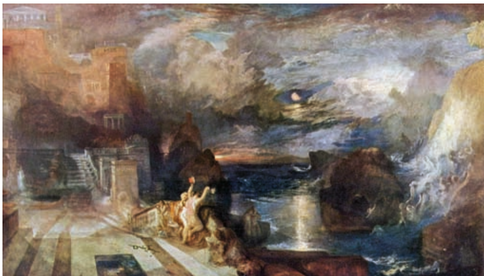
52. William Turner: Héro és Leander búcsúja , 1837, olaj, vászon, Tate Gallery, London