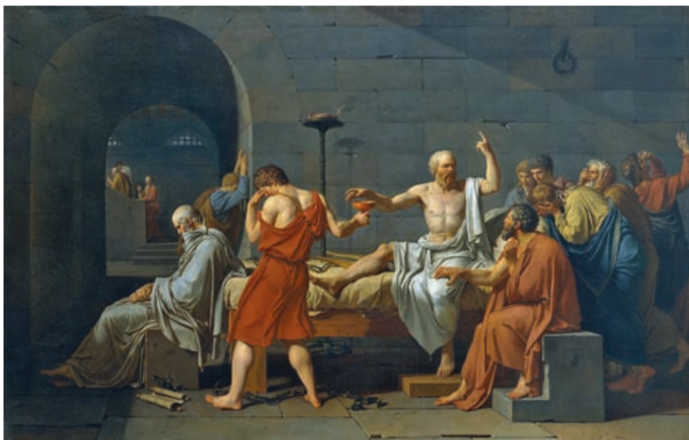
23. Jacques-Louis David: Szókratész halála, 1787, olaj, vászon, 130 x 196 cm, Metropolitan Museum of Art, New York