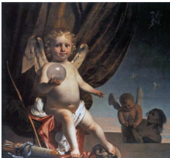
30. Caesar van Everdingen: Ámor üveggömbbel , 1660 k., olaj, vászon, 89 x 102 cm, magángyűjtemény