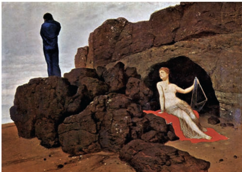
8. Arnold Böcklin: Odüsszeusz és Kalüpszó , 1883, Kunstmuseum, Bázél