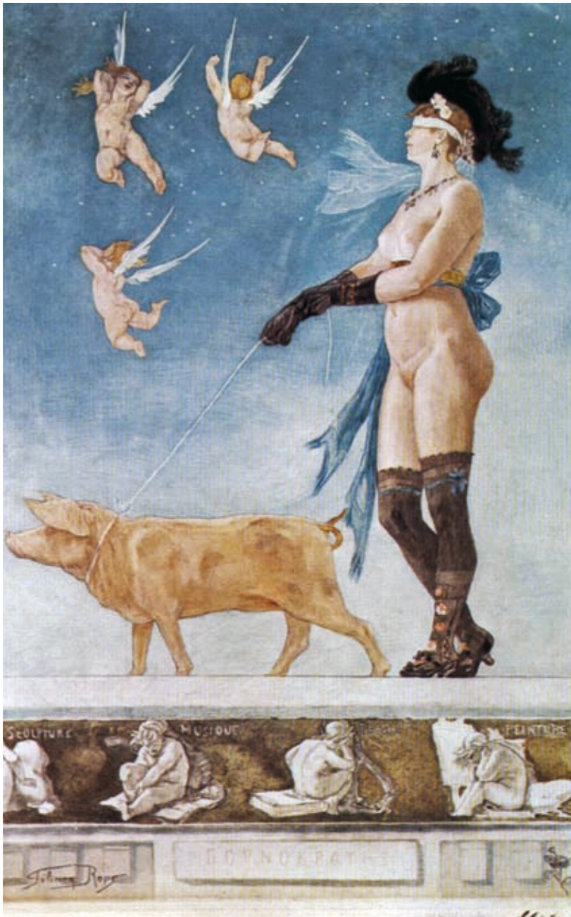
34. Félicien Rops: Pornokratész , 1896