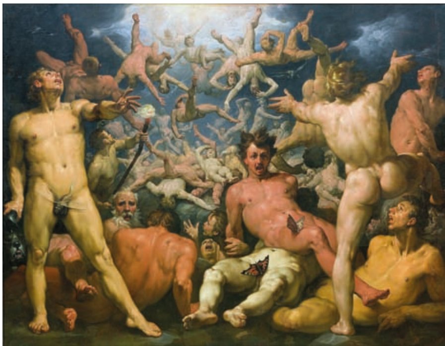
19. Cornelis van Haarlem: Titánok bukása, 1588–1590, olaj, vászon, Statens Museum for Kunst, Koppenhága