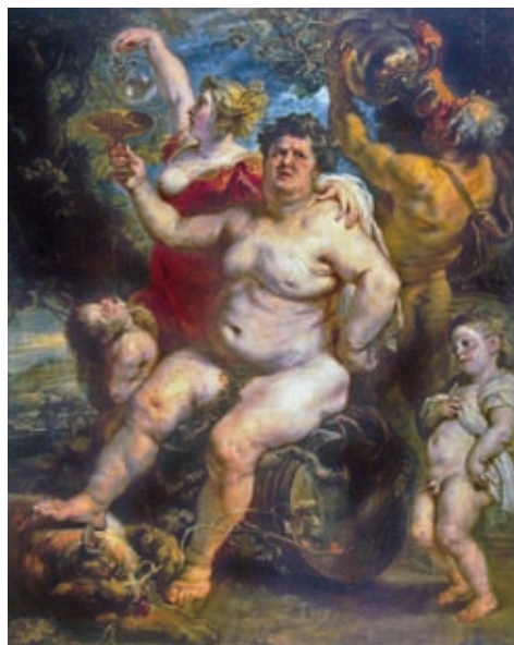
57. Peter Paul Rubens: Bakkhosz, 1638–1640, olaj, vászon (eredetileg fatáblán), 191 x 161 cm, Ermitázs, Szentpétervár