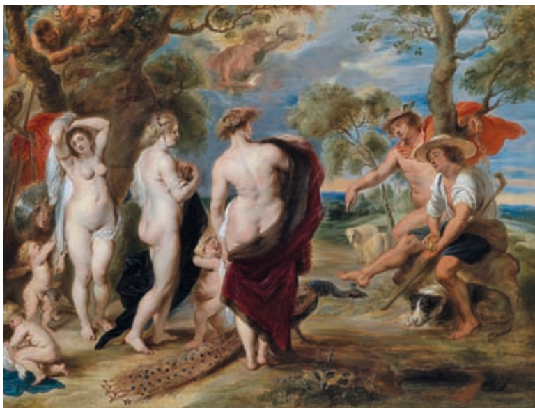
14. Peter Paul Rubens: Párizs ítélete , 1636 k., olaj, fatábla, 145 x 194 cm, National Gallery, London