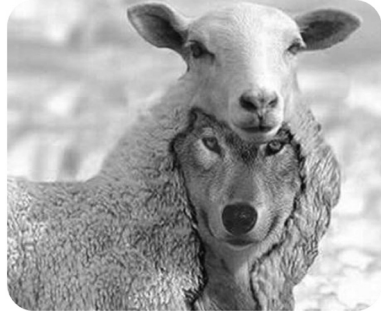
2. ábra Sötét Triád: bárányszőrből bujt farkasok

szik utálatossá a Sötét Hármas személyeket, de természetesen karakterjegyeik összessége már jóval negatívabb konstellációt eredményezhet. Általában véve az erkölcs és tisztesség hiánya vagy csökkent mértéke szabad utat nyit a saját érdekek előtérbe helyezésének, akár mások kárára is (Veselka, Schermer és Vernon, 2012). A Sötét Hármas személyek mindennapi kapcsolataikban nemcsak énközpontúak,