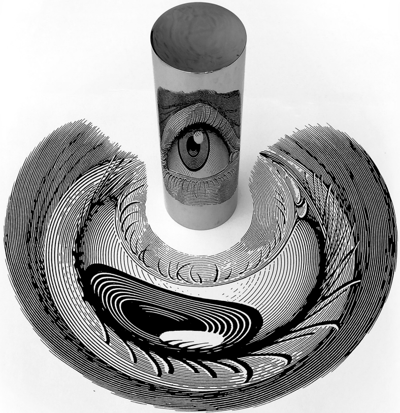
Orosz István: Szem, tükröhengeres anamorfózis, tusrajz (1999)