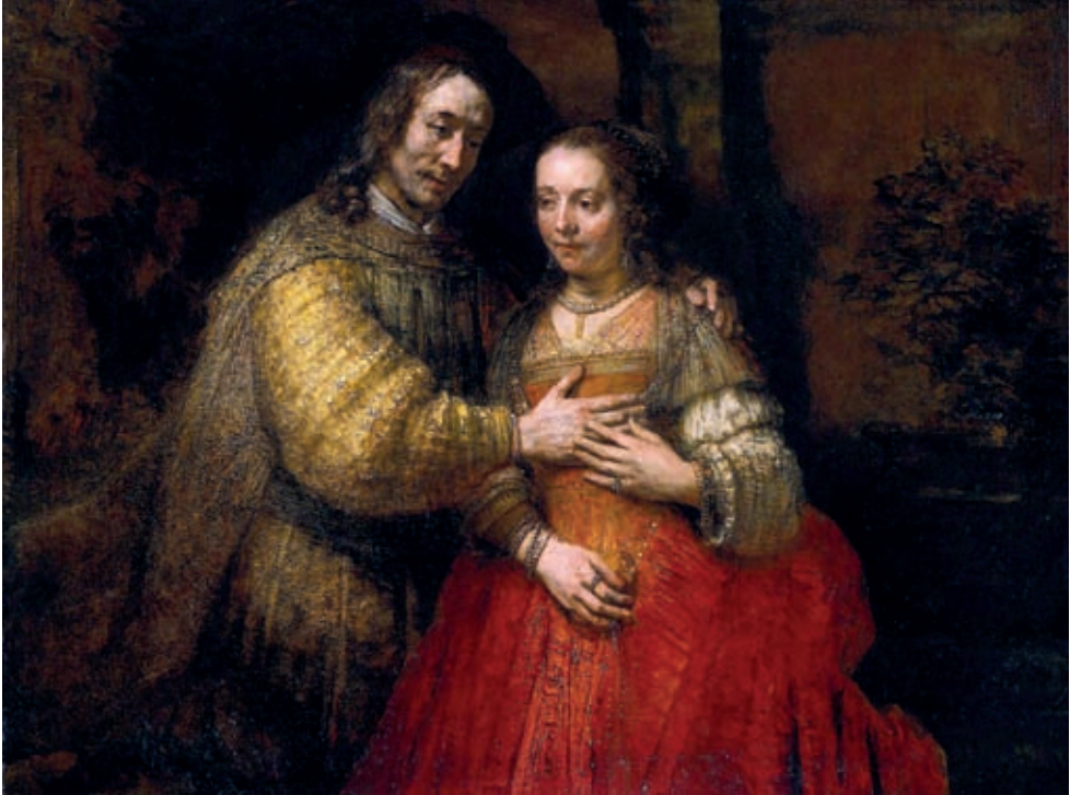
XVIII. Rembrandt van Rijn: A zsidó menyasszony , 1666–1668, Amszterdam, Rijksmuseum