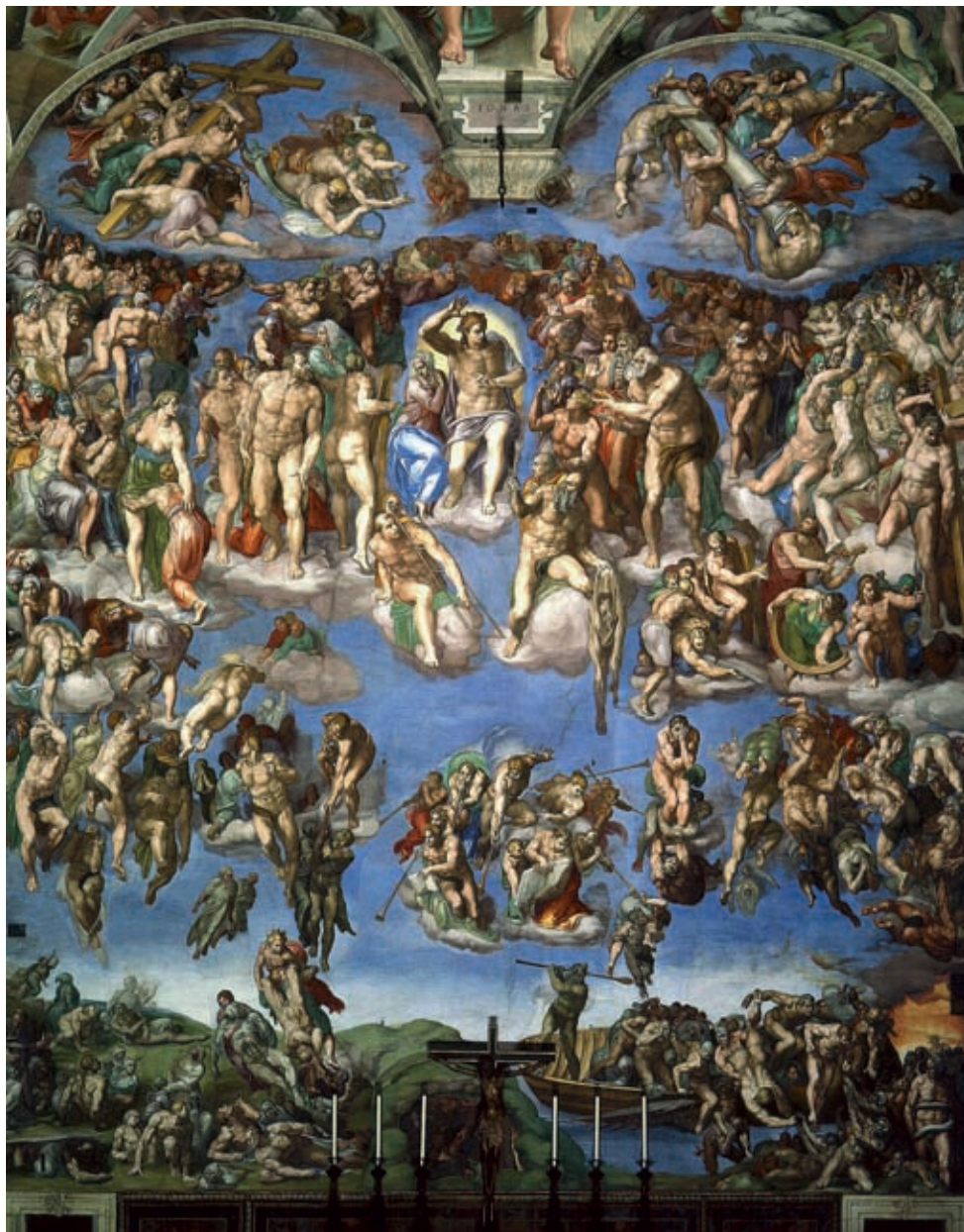
XIV. Michelangelo Buonarroti: Utolsó ítélet , 1509–1512, Róma, Vatikán, Sixtus-kápolna