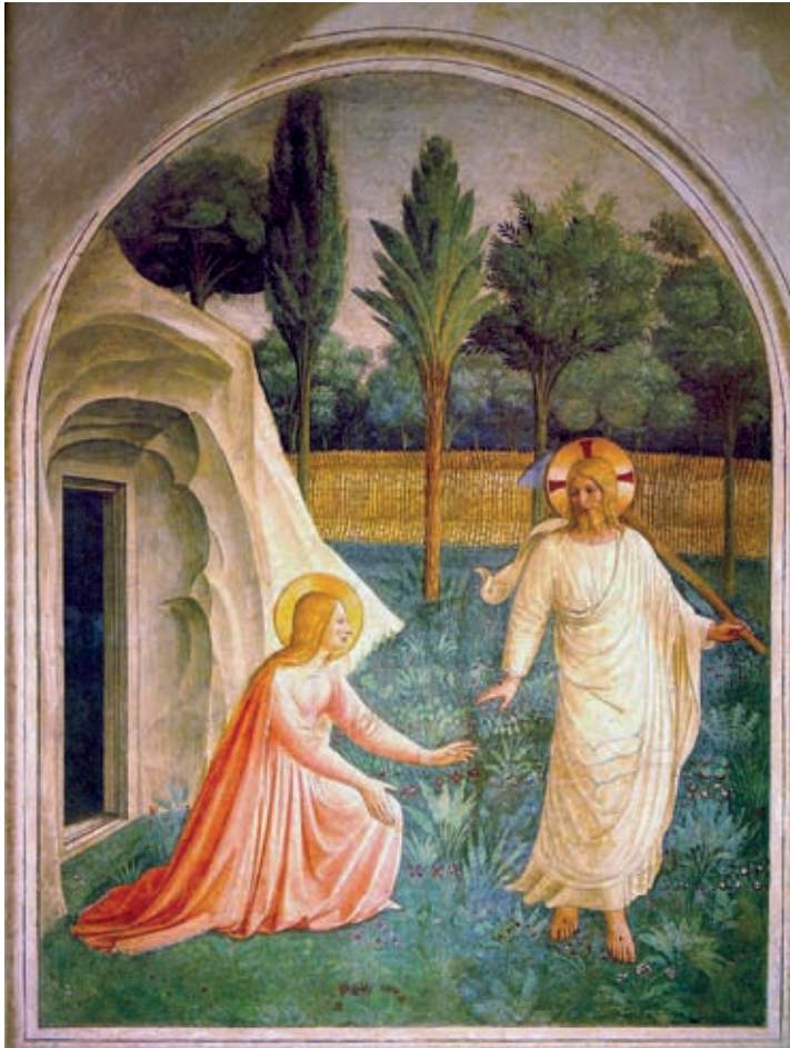
XXI. Fra Angelico: Noli me tangere , 1440–1442, Firenze, San Marco