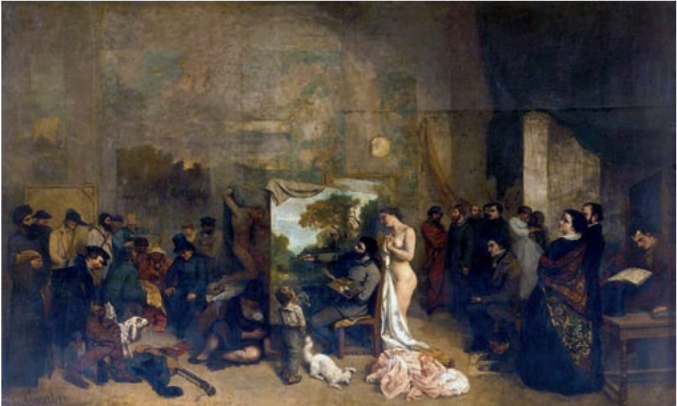
X. Gustave Courbet: A festő műterme , 1855 k., Párizs, Musée d'Orsay