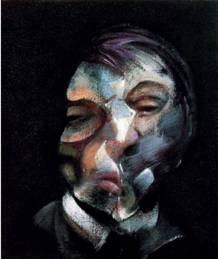
XIII. Francis Bacon: Önarckép , 1971, Párizs, Centre George Pompidou