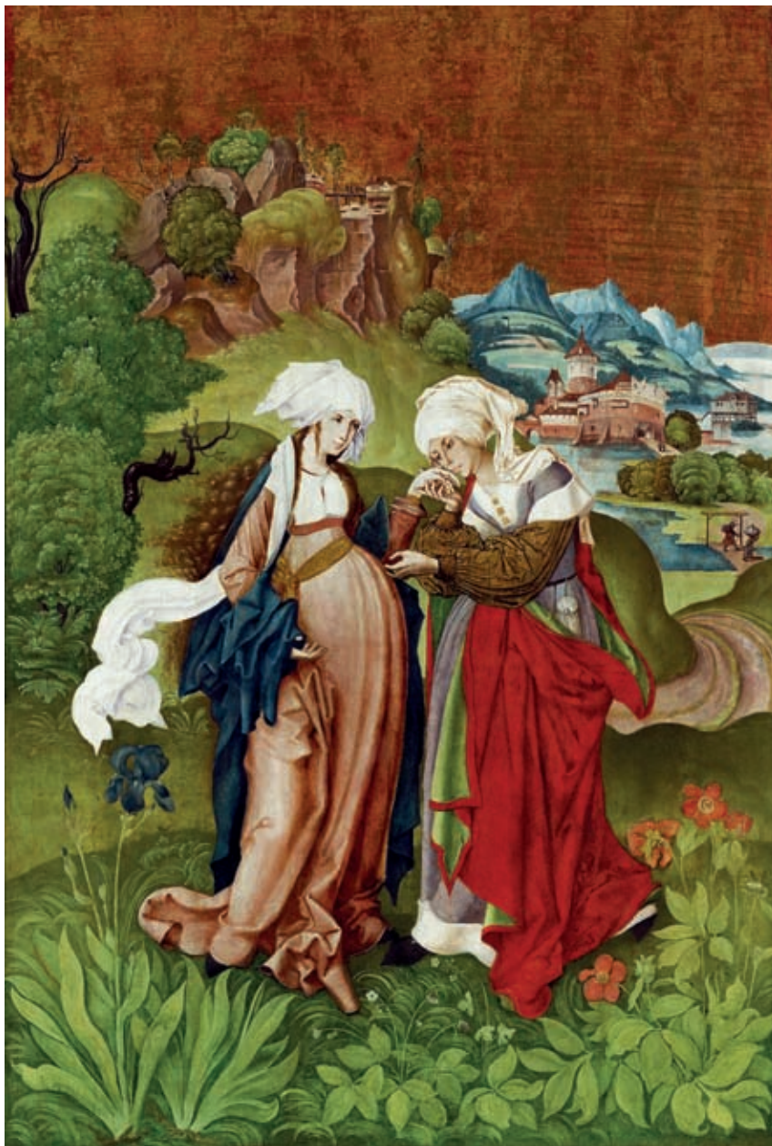
XIX. M. S. mester: Vizitáció , 1506, Budapest, Magyar Nemzeti Galéria