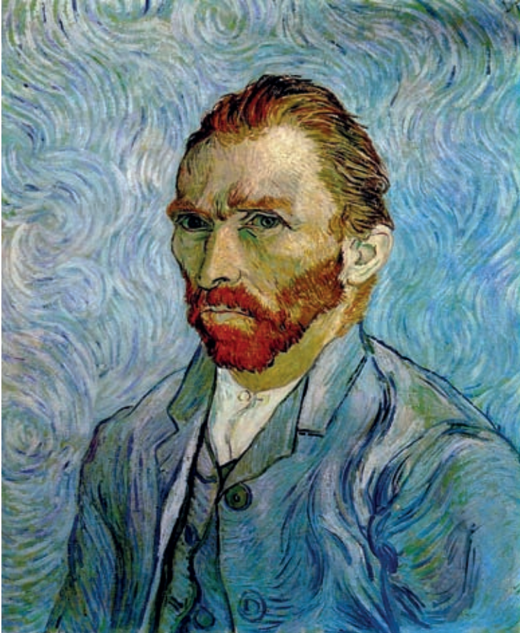
V. Vincent van Gogh: Önarckép , 1889, Párizs, Musée d'Orsay