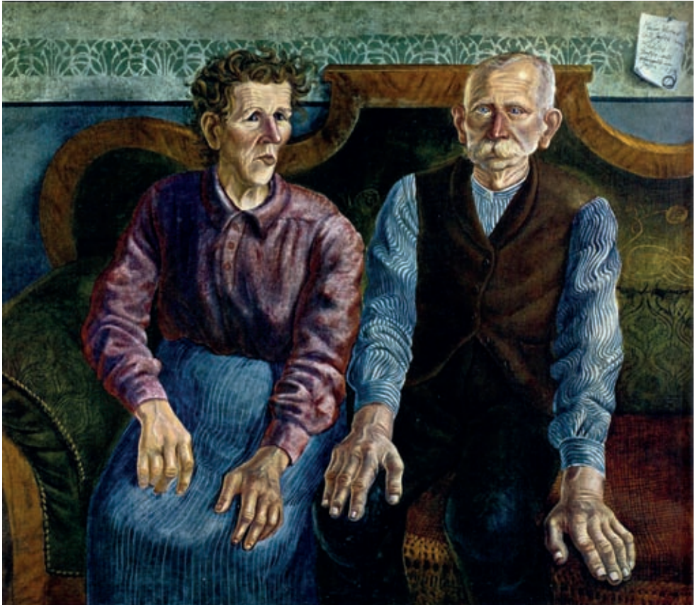
XVII. Otto Dix: A művész szülei , 1924, Hannover, Sprengel Museum