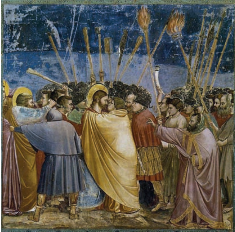
VI. Giotto di Bondone: Júdás csókja , 1305–1306, Padova, Scrovegni-kápolna