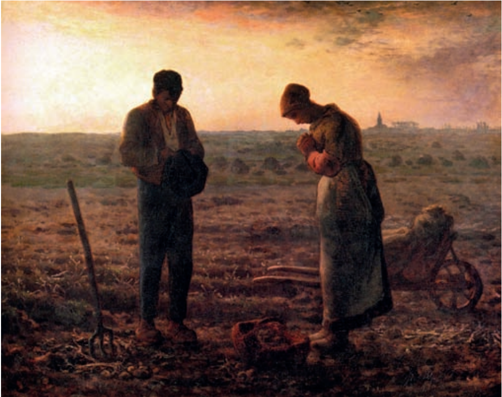
XVI. Jean-François Millet: Angelus (Esti harangszó), 1858–1859, Párizs, Musée d'Orsay