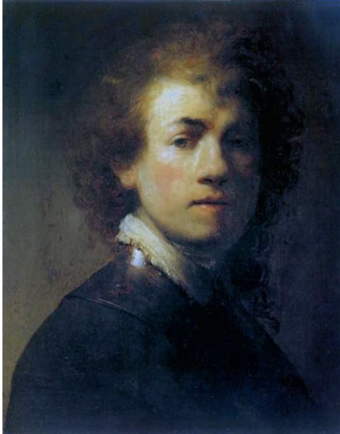
III. Rembrandt van Rijn: Önarckép , 1629, Hága, Mauritshuis Museum