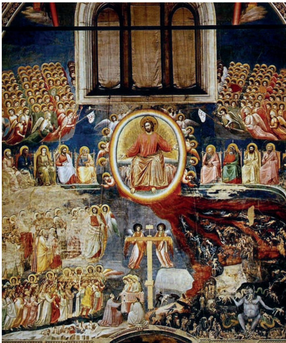
II. Giotto di Bondone: Utolsó ítélet , 1305–1306, Padova, Scrovegni-kápolna