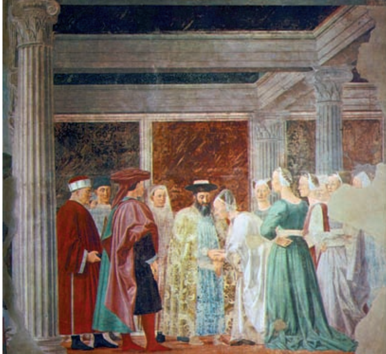
XX. Piero della Francesca: Salamon és Sába királynőjének találkozása 1452, Arezzo, Basilica di San Francesco