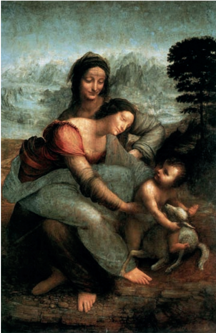
VII. Leonardo da Vinci: Szent Anna harmadmagával , 1510 k. Párizs, Louvre