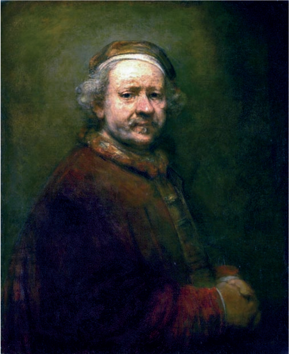
XII. Rembrandt van Rijn: Önarckép , 1669, London, National Gallery