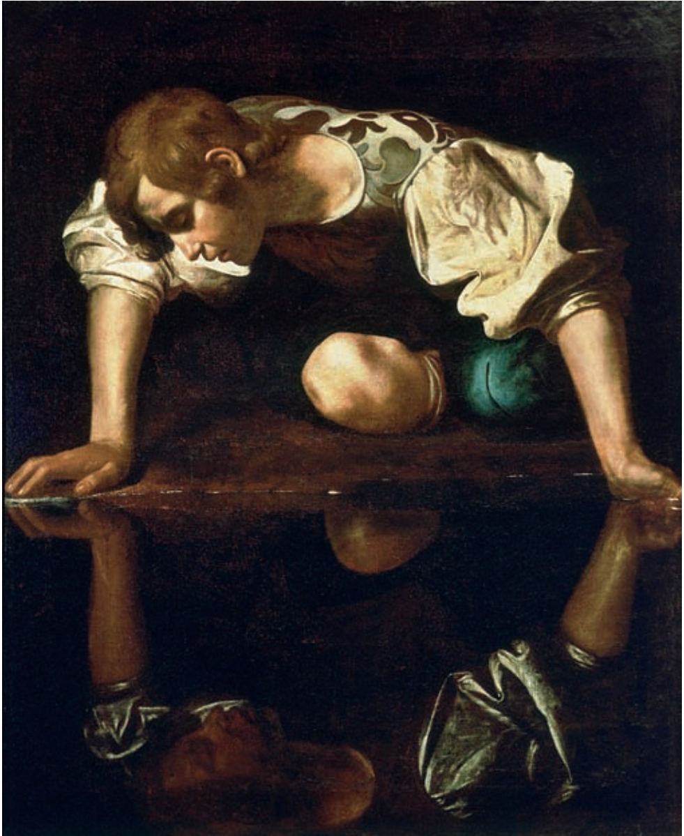
XI. Caravaggio: Narkisszosz , 1597–1599 k., Róma, Galleria Nazionale d'Arte Antica