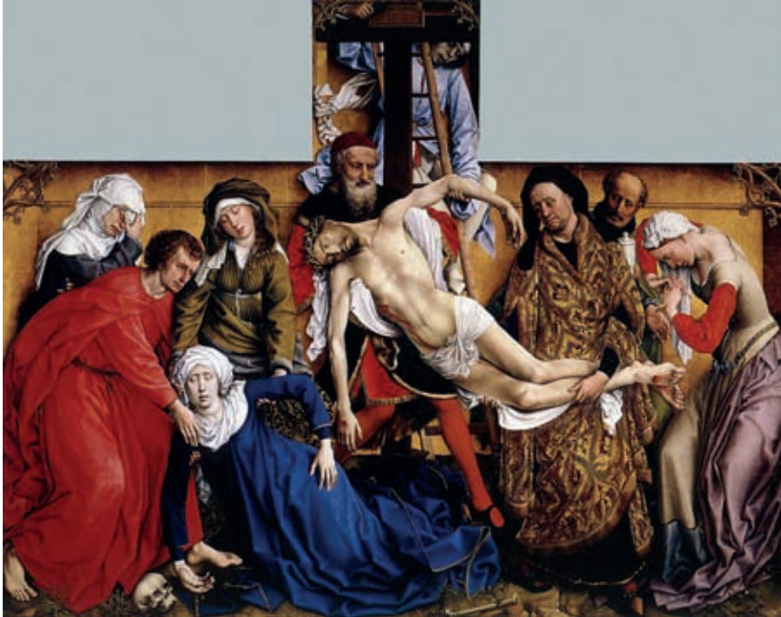
I. Rogier van der Weyden: Keresztlevétel , 1435–1436, Madrid, Museo del Prado