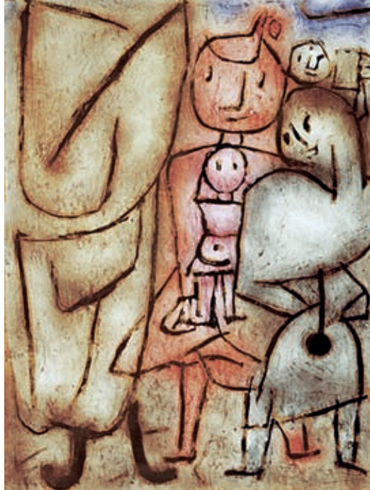
XXII. Paul Klee: Tömeg , 1939 Bern, Zentrum Paul Klee