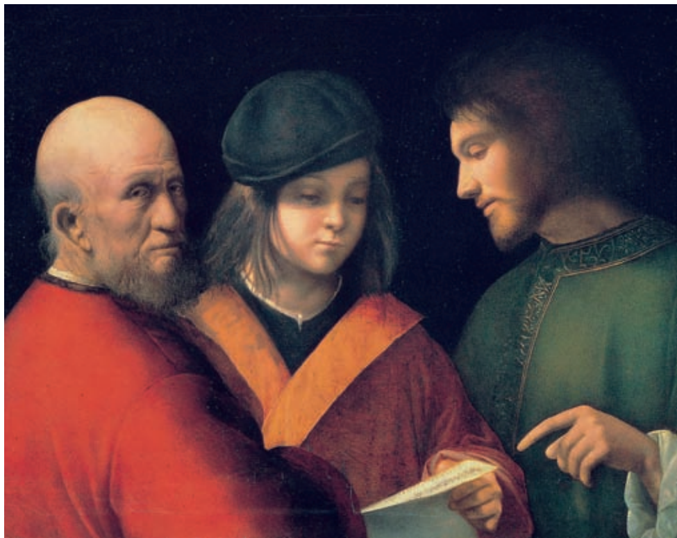
XV. Giorgione da Castelfranco: Az ember életének három korszaka , 1500 Firenze, Palazzo Pitti