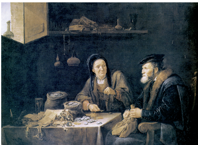
10. Az ifjabb David Teniers: A kapzsi (17. sz.). London, National Gallery