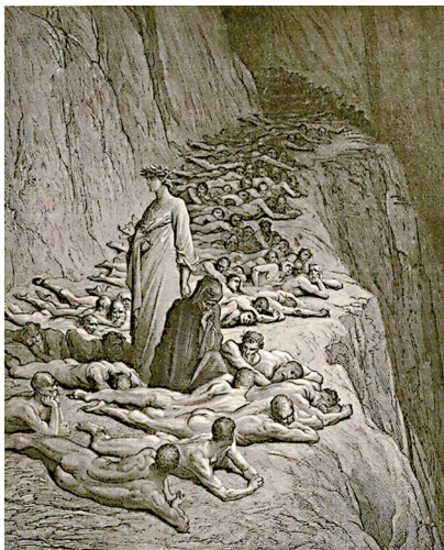
3. A fősvények Dante Purgatóriumában (XIX. ének, 133–135. sor). Doré illusztrációja az Isteni színjáték egyik 19. század végi kiadásából