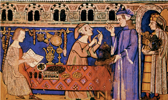
8. Ismeretlen festő: Az uzsorások A hét főbűn című kéziratból. London, Brit Nemzeti Könyvtár