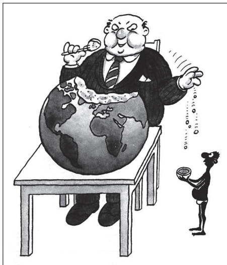
12. Is Capitalism Just Another Name for Greed? (A kapitalizmus csak egy új szó a fősvénységre?). Ábra egy amerikai blogból