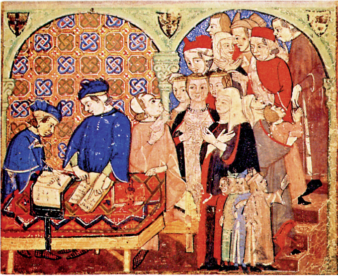
7. Egy 14. századi itáliai bank belseje. A miniatúrán jól láthatók a pénztárkönyvek és a külfölddel üzletelő kereskedők iratai.