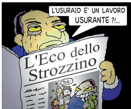
13. Az uzsorás lapja. Angese rajza (2007. október 16.). A képregény szövege: „az uzsora olyan szakma, ami elhasználja az embert?”. (Lefordíthatatlan szójáték az usura 'uzsora' és az usurare 'elhasznál' szavak felhasználásával.)