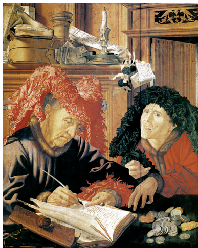
9. Marinus van Reymerswaele: A két pénzbeszedő (1540 k.). London, National Gallery